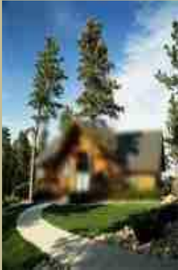
une maison splendide