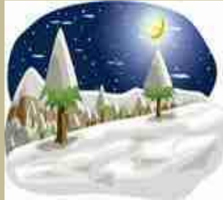
un joli paysage