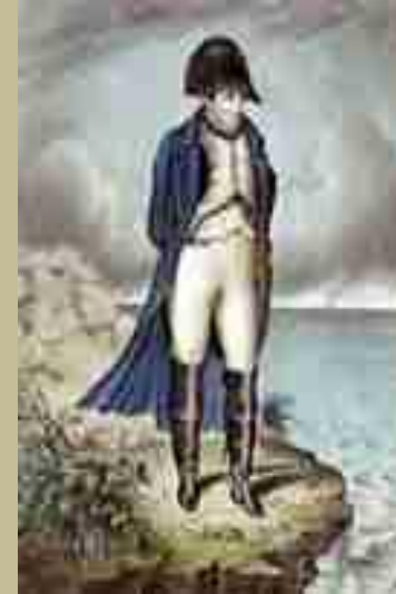
un grand homme (Napoléon (qui a réalisé beaucoup de choses)