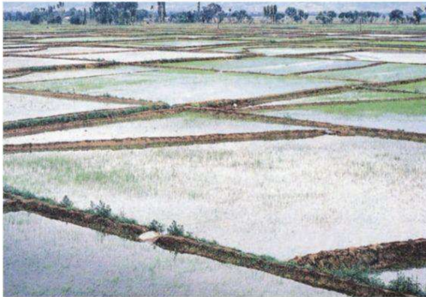
Viset e parcelave me Oriz (te popullsia e njohur si gjolovi) në Fushën e Orizit - të Koçanës.

Parcelat e orizit domosdo çdoherë të jenë të mbushura me ujë i cili lëshohet që nga mbjellja dhe mbetet deri në fund të vegetacionit. Për shkak të kushteve specifike që i kërkon gjatë mbjelljes, në Maqedoni prodhohet vetëm në tri zona: Fushëgropën e Koçanës, Fushëgropën e Strumicës-Radovishit dhe Titovelesit. Më e përhapur është në fushëgropën e Koçanës, ku ekzistojnë kushte optimale për prodhimin tij.