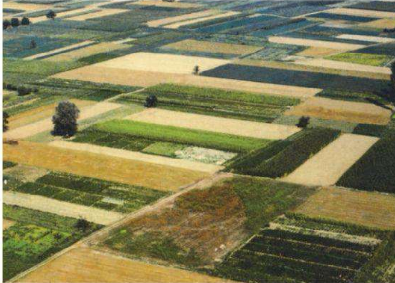
Peizazh agrar në Pellagoni. Ndarja në numrin e madh të parcelave të vogla paraqet faktorë kufizues për zhvillimin e bujqësisë.

Kurse në zhvillimi i bujqësisë rëndësi të theksuar ka edhe politika ekonomike. Ajo me rolin e saj orientues dhe investimet e përcakton përhapjen e prodhimeve bujqësore, ndikon mbi specializimin dhe regjionalizimin e atij prodhimi etj.